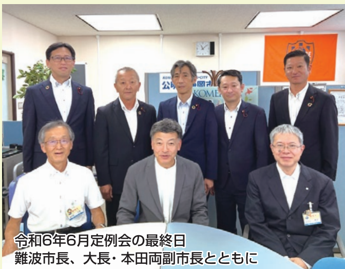
令和6年6月定例会の最終日 難波市長、大長・本田両副市長とともに